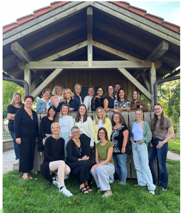
Das pädagogische Team