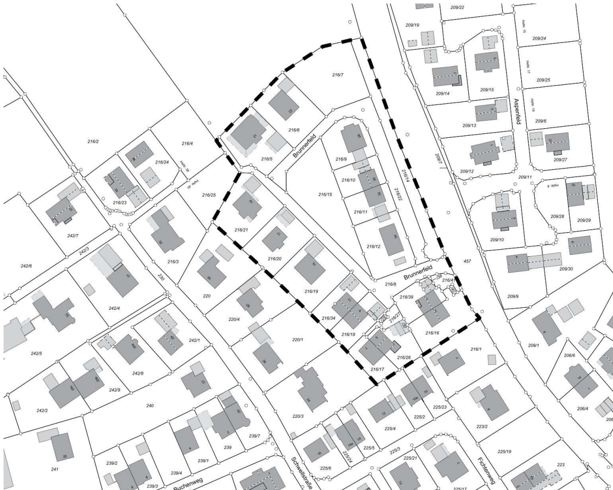
Abb.: Lageplan mit Änderungsbereich 1. Änderung des Bebauungsplans „Brunnerfeld“

Der Änderungsbereich umfasst einen ca. 1,1 ha großen Bereich um die Straße Brunnerfeld im Norden von Saaldorf, welcher größtenteils mit Einfamilien- und Doppelhäusern bebaut ist. Eine Parzelle ist derzeit noch unbebaut.