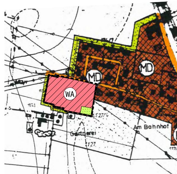
M 1:5.000 N^