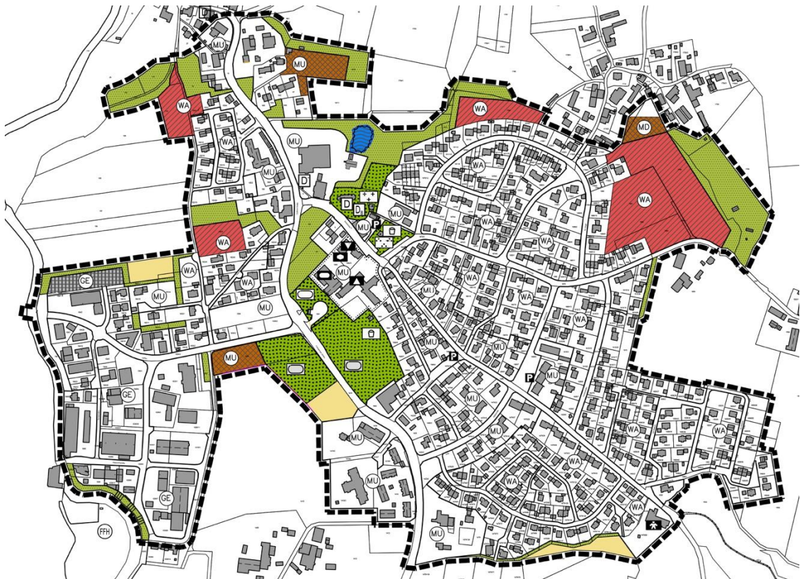
Abb. Neuausweisung noch unbebauter Flächen (WA, MU, GE)

Die Einbindung der neuen Baulandflächen in das Orts- und Landschaftsbild wird durch großzügige Grünflächen gewährleistet.