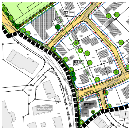
Abb.: Kennzeichnung der Schallfestsetzung Verkehrslärm (dunkelgrün)

Schützenswerte Räume (Wohn-, Schlaf- und Kinderzimmer) an den in der Planzeichnung gekennzeichneten Fassaden entlang der Kreisstraße BGL2 sind im Falle einer Nutzungsänderung, eines Um- und Erweiterungsbaus der bestehenden Gebäude oder eines Neubaus nach der verkehrslärmabgewandten Gebäudeseite (Ostseite) hin zu orientieren. Falls dies aus nachvollziehbaren Gründen nicht möglich ist, müssen die Außenbauteile schützenswerter Räume an den zu o.g. Straße gewandten Hausseiten durch Schallschutzmaßnahmen am Gebäude entsprechend der Anforderungen nach DIN 4109-1: 2018-01 geschützt werden. Dabei sind in dem, in der Planzeichnung in dunkelgrün gekennzeichneten Bereich Fenster von Schlaf- und Kinderzimmern mit einer schallgedämmten Lüftungseinrichtung auszustatten. Schallgedämmte Lüftungseinrichtungen müssen beim Nachweis des erforderlichen resultierenden Schalldämm-Maßes der Außenbauteile berücksichtigt werden.