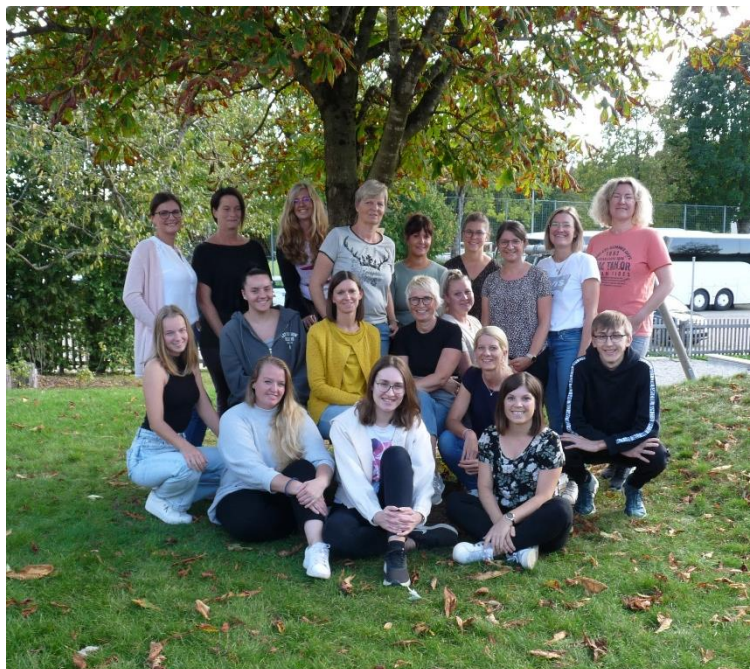
Das pädagogische Team