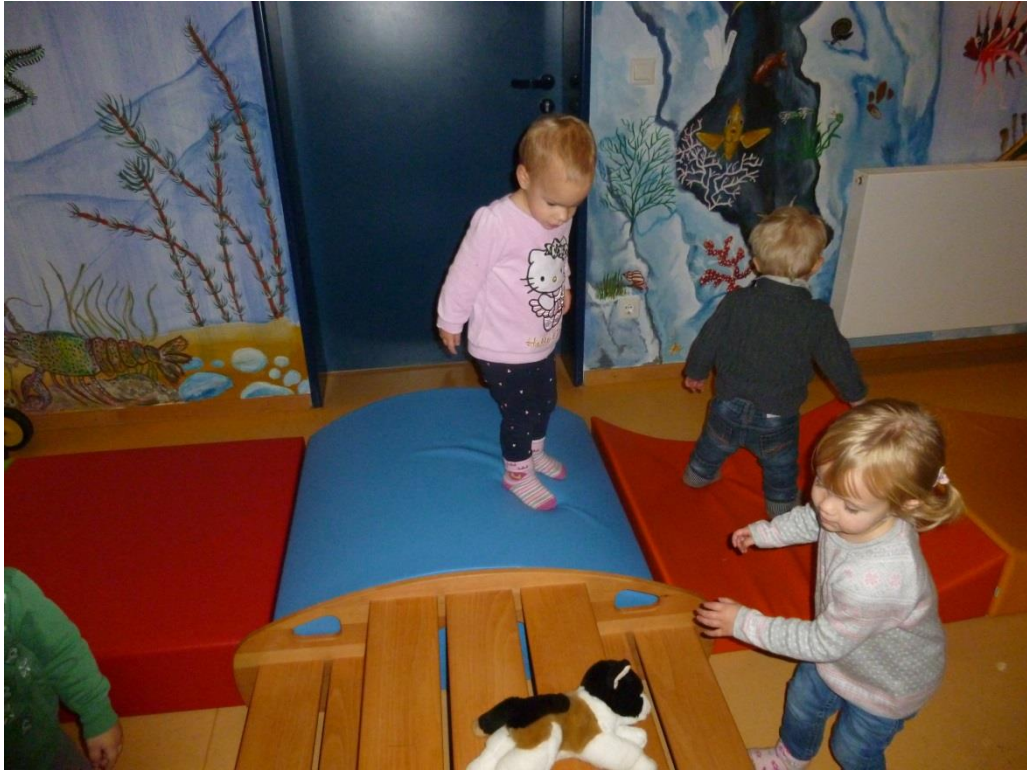
Auf der Bewegungsbaustelle