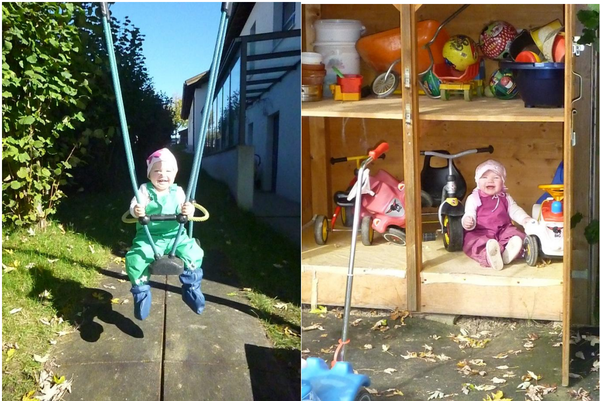
Garten mit Spielplatz