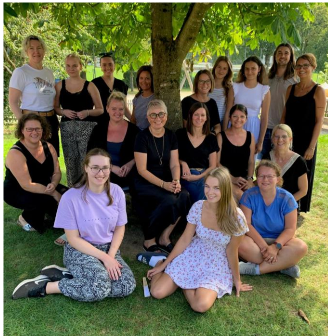
Das pädagogische Team