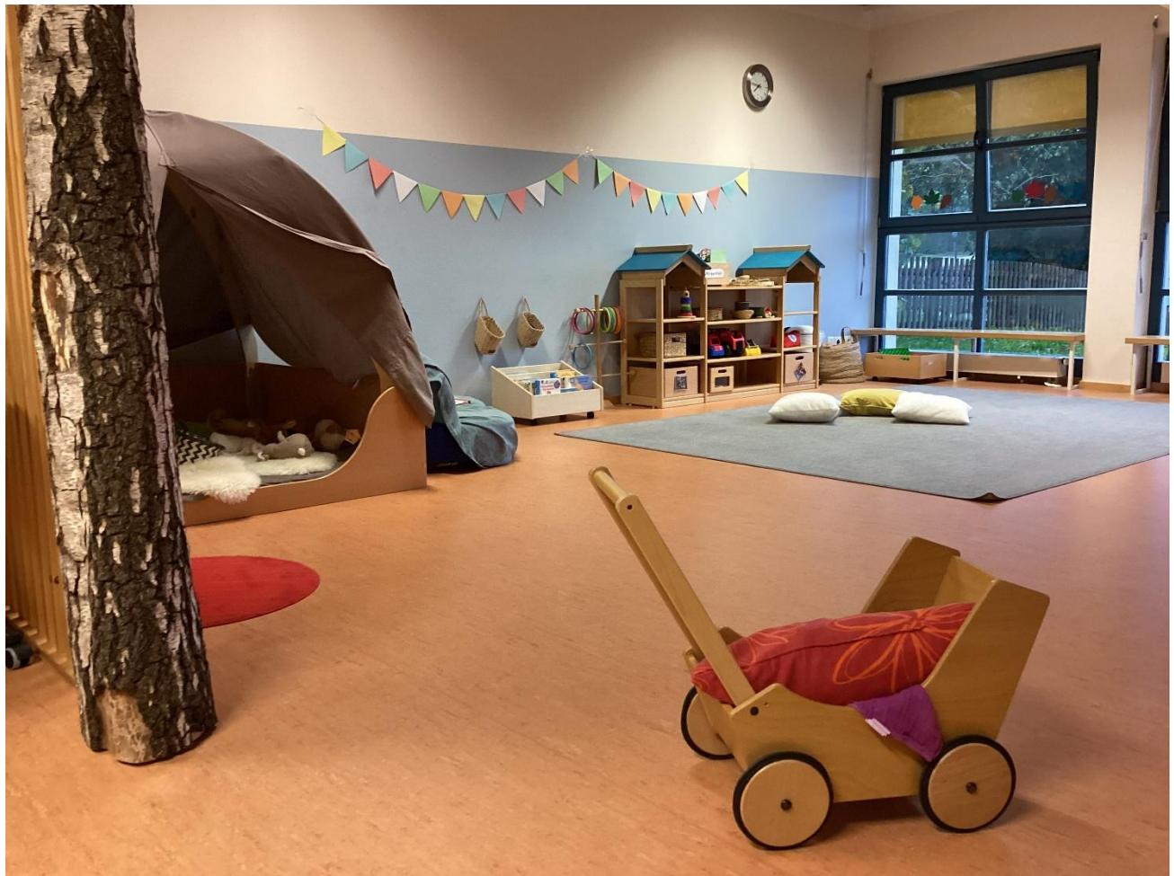
Kinderkrippe Gänseblümchen Gruppenraum

Die Kinderkrippe mit separatem Eingang befindet sich im unteren Stockwerk des Hauses. Die Krippe ist ausgestattet mit zwei freundlichen, hellen Gruppenräumen, zwei Garderobenräumen, einer Spielstraße im geräumigen Flur, einer Küche, einem Schlafräum mit Kinderbetten und dem Wickelbereich mit Toiletten. Außerdem bietet ein zusätzlicher Bewegungsraum Platz für Aktivitäten der Kinder. Die Räumlichkeiten sind so gestaltet, dass sie für Kinder eine ansprechende Lernumgebung bieten, in der sie ohne Gefahren in ein freies Spiel gehen können.