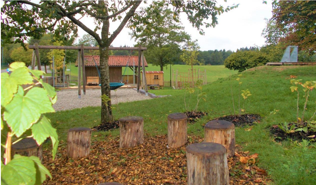
Garten mit Spielplatz

In unserer Wasserwelt können die Kinder mit Wasser schütten und matschen, im Akrobatenbereich können sie ihr Kletter- und Balanciergeschick erproben, im Gartenreich kann an Hochbeeten gegärtnert und von den leckeren Beerenbüschen genascht werden, in der Sandwelt wartet ein großer Sandkasten und eine Outdoorküche auf die Kinder, in der Bergwelt können die Kinder klettern, rutschen und auf der Formel-1 Strecke mit Fahrzeugen Wettrennen veranstalten.