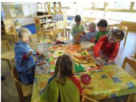
Malen mit Wasserfarben

Für die Kinder liegen sowohl im Gruppenraum, als auch in unserem Kreativraum immer Malutensilien (Papier, Stifte, Pinsel,), verschiedene Naturmaterialien (Zapfen, Kastanien, Federn), Stoffreste, Scheren und Kleber bereit. An der Werkbank lernen die Kinder unterschiedliche Holzarten kennen und üben den Umgang mit verschiedenen Werkzeugen. Nach einer ausführlichen Einführung und Übung erhalten die Kinder einen „Werkbank-Führerschein“. Gelenkte Angebote, wie malen nach Musik oder das bildnerische Gestalten verschiedener Themen regen Kreativität und Phantasie der Kinder an. Das Kind lernt Materialien unterschiedlichster Art kennen und mit diesen ästhetisch, bildnerisch und spielerisch etwas zu gestalten.