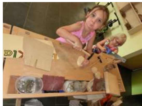
Arbeiten an der Werkbank