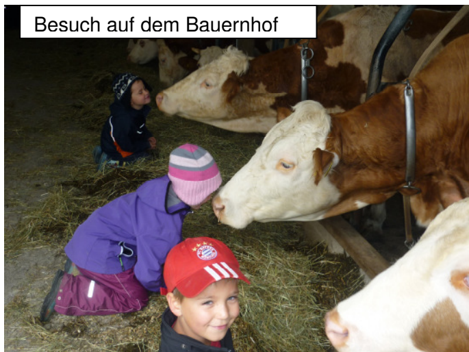
Besuch auf dem Bauernhof

Einen Tag auf dem Bäckbauernhof durften die Vorschulkinder erleben. Mit viel Geduld beantworteten die Bauersleut die vielen Fragen der Kinder. Im Kuhstall durften die Kühe gefüttert werden, die Hasen waren für einige Streicheleinheiten sehr dankbar und ein Huhn legte termingerecht ein Ei. Nach einer gesunden Brotzeit wurden beim Seilziehen und Gummistiefelwerfen noch die Kräfte erprobt.