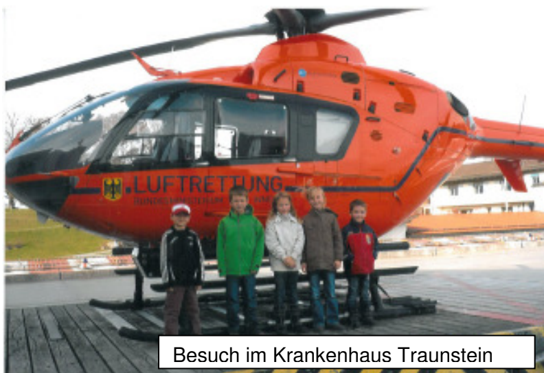
Besuch im Krankenhaus Traunstein

Die Betreuerinnen haben für jede Ferienbetreuung ein ansprechendes Programm. So fand zum Beispiel auch ein Besuch im Krankenhaus Traunstein statt. Nach Besichtigung der Kinderstation durften die Saaldorf-Surheimer Kinder den Rettungshubschrauber aus der Nähe betrachten.