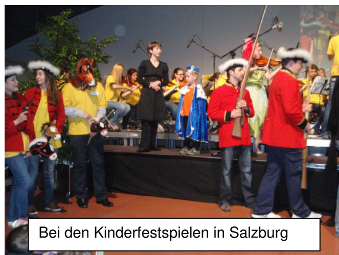
Bei den Kinderfestspielen in Salzburg

Viel Spaß hatten die Kinder des Kindergarten St. Stephan im Mai bei ihrem Ausflug zu den Kinderfestspielen nach Salzburg. Den Kindern wurde ein unterhaltsames Musikabenteuer geboten. Auf kindgerechte Weise wurden die jungen Zuhörer mit dem Stück: „Die vier Jahreszeiten“ von Vivaldi vertraut gemacht. Bereits vor zwei Jahren durften die Kinder dort das Stück: „Der Zauberlehrling“ nicht nur musikalisch, sondern auch kindgerecht dargestellt erleben.