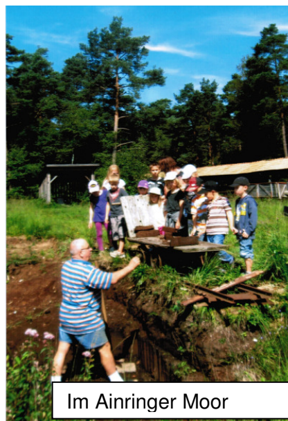
Im Ainringer Moor

Die Ferienbetreuung in Surheim bietet den Kindern schöne Abwechslungen. So stand ein Besuch im Ainringer Moor auf dem Programm. Die Kinder erlebten die Vielfalt der Blumen und durften mit der Bockelbahn fahren und es wurde ihnen erklärt, wie Torfstechen funktioniert